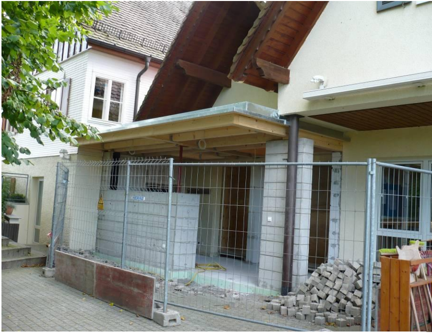
Vor dem bisherigen Eingang entsteht ein Anbau