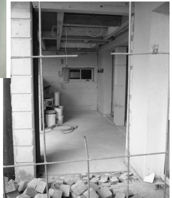
die Handwerker haben noch viel zu tun

Wir freuen uns schon auf den Moment, wo die aus Elternspenden finanzierte neue Garderobe zur Benützung freigegeben werden kann und danken allen, die sich dafür stark gemacht und es durchgeführt haben!