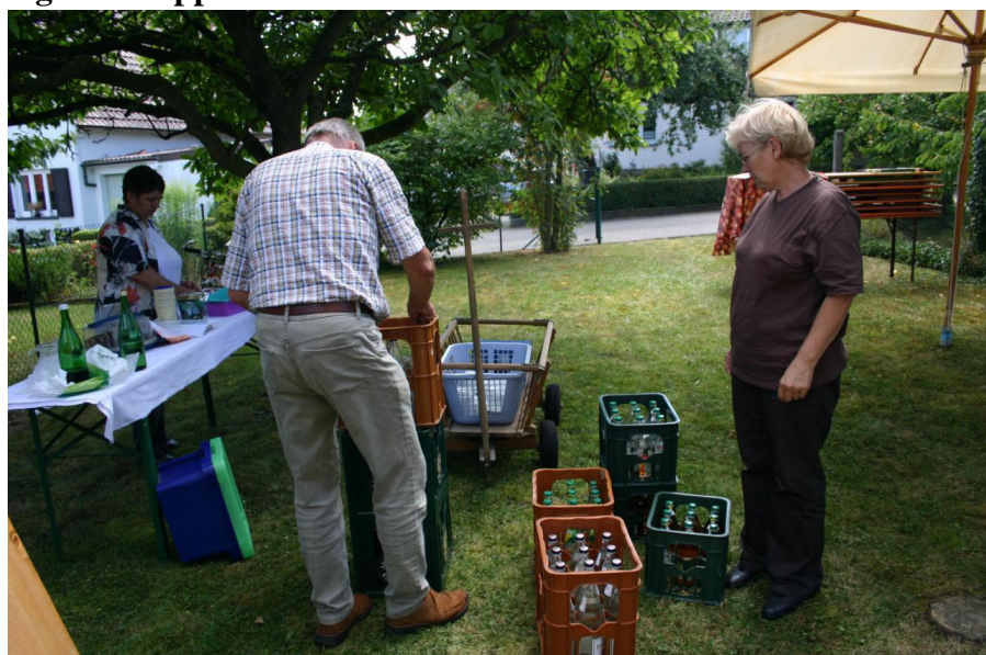
Herzlichen Dank an alle HelferInnen!