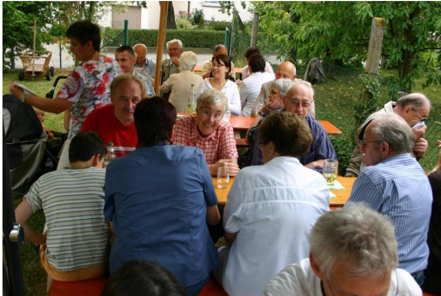
Viele Generationen - eine Gemeinde