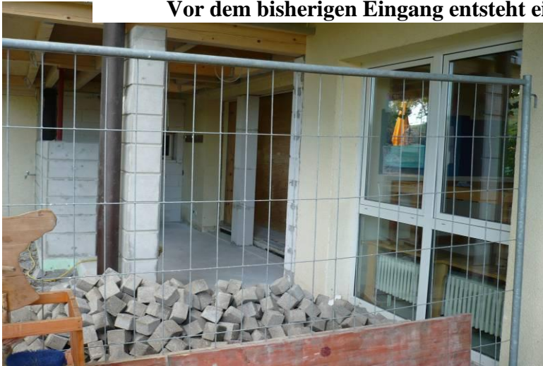
Es entsteht Platz für die neue Garderobe

Eine Baustelle direkt vor der Kindertentür macht zwar Lärm und Schmutz, ist aber für die Kinder eine spannende Sache! Und wir alle freuen uns jetzt schon auf die neuen Möglichkeiten, wenn jedes Kind seinen Garderobenplatz mit eigenem Fach hat. Und wenn trotzdem im Foyer des Steinbeiskindergartens noch Raum ist, sich zu Begrüßen und zu Begegnen oder Informationen auszutauschen!