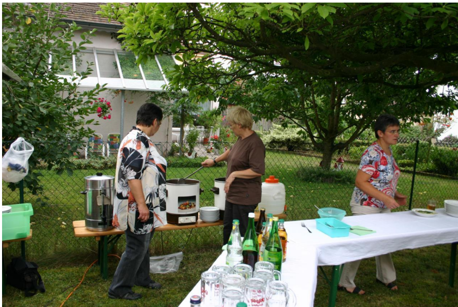
Fertig zum Suppe fassen!